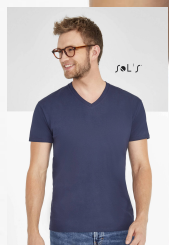
IMPERIAL V MEN 02940