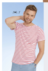
MILES MEN 01398