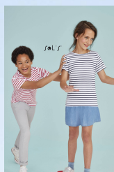
MILES KIDS 01400