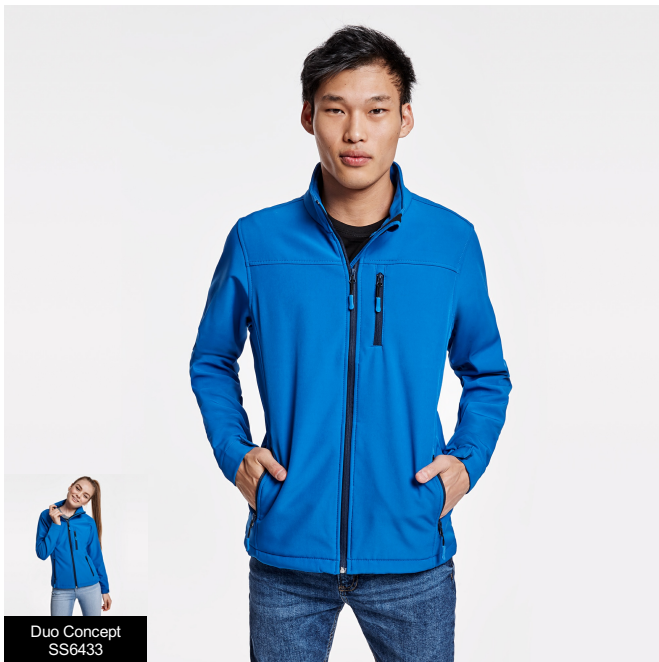
Duo Concept SS6433