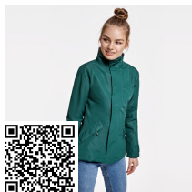
EUROPA WOMAN PK5078