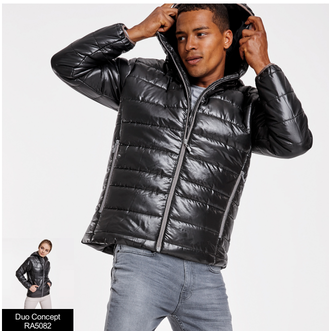
Duo Concept RA5082