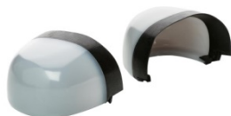
Puntera no metálica