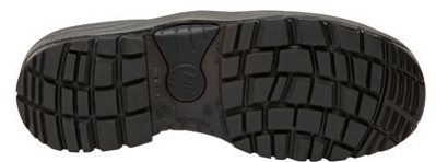
Suela Antiestática + Resistente a los hidrocarburos