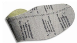
Plantilla de protección flexible