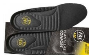
Plantillas extraíbles. Lavable