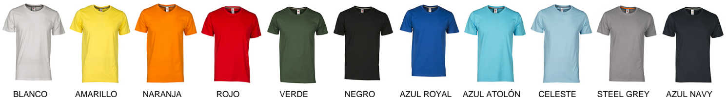
BLANCO AMARILLO NARANJA ROJO VERDE NEGRO AZUL ROYAL AZUL ATOLÓN CELESTE STEEL GREY AZUL NAVY