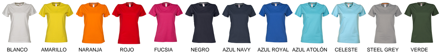
BLANCO AMARILLO NARANJA ROJO FUCSIA NEGRO AZUL NAVY AZUL ROYAL AZUL ATOLÓN CELESTE STEEL GREY VERDE