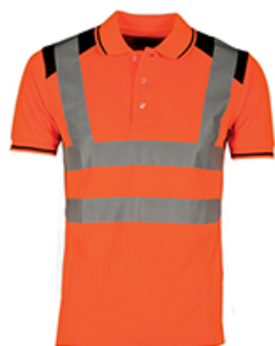
NARANJA FLUO/AZUL NAVY