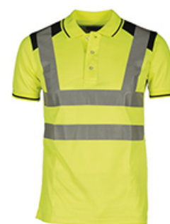
AMARILLO FLUO/AZUL NAVY