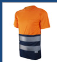
032 Marino/ Naranja AV