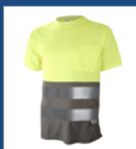
051 Gris/ Amarillo AV