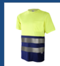
041 Azulina/ Amarillo AV