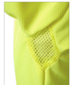
Detalle de las axilas