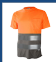
052 Gris/ Naranja AV