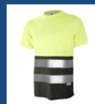
091 Verde oscuro/ Amarillo AV