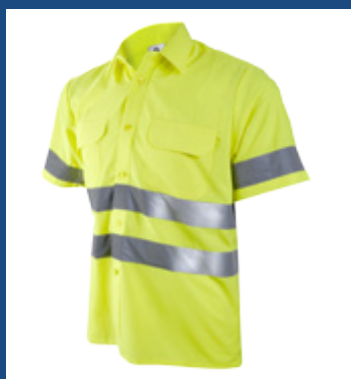
001 Amarillo AV