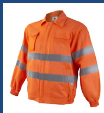
002 Naranja AV