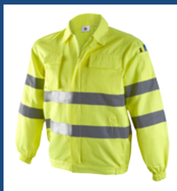
001 Amarillo AV