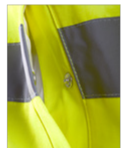
Bolsillos con clip