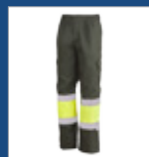
091 Verde oscuro/ Amarillo AV