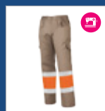
122 Beige/ Naranja AV