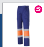
042 Azulina/ Naranja AV