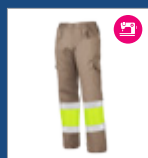
121 Beige/ marillo AV