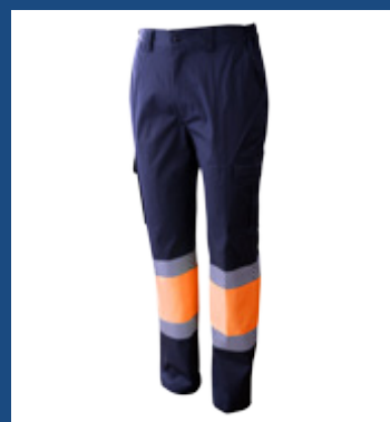
032 Marino/Naranja AV