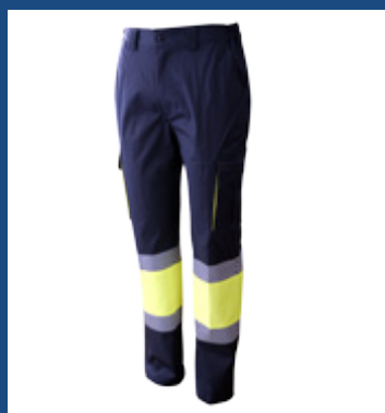
031 Marino/Amarillo AV

OEKO-TEX® CONFIDENCE IN TEXTILES STANDARD 100