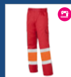
132 Rojo/ Naranja AV