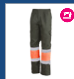
092 Verde oscuro/ Naranja AV