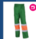
102 Verde medio/ Naranja AV