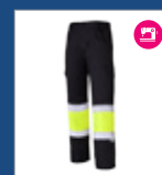
061 Negro/ Amarillo AV