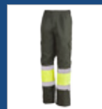
091 Verde oscuro/ Amarillo AV