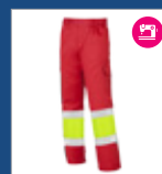
131 Rojo/ Amarillo AV