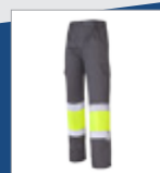
051 Gris/ Amarillo AV