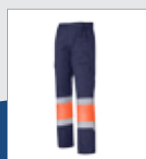
032 Marino/ Naranja AV