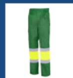
101 Verde medio/ Amarillo AV