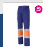
042 Azulina/ Naranja AV