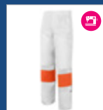
072 Blanco/ Naranja AV