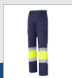
031 Marino/ Amarillo AV