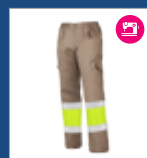
121 Beige/ marillo AV