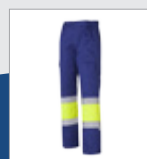
041 Azulina/ Amarillo AV