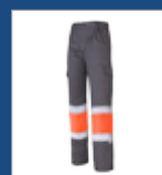
052 Gris/ Naranja AV