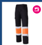
062 Negro/ Naranja AV