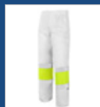
071 Blanco/ Amarillo AV