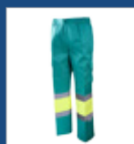
111 Verde claro/ Amarillo AV