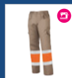
122 Beige/ Naranja AV