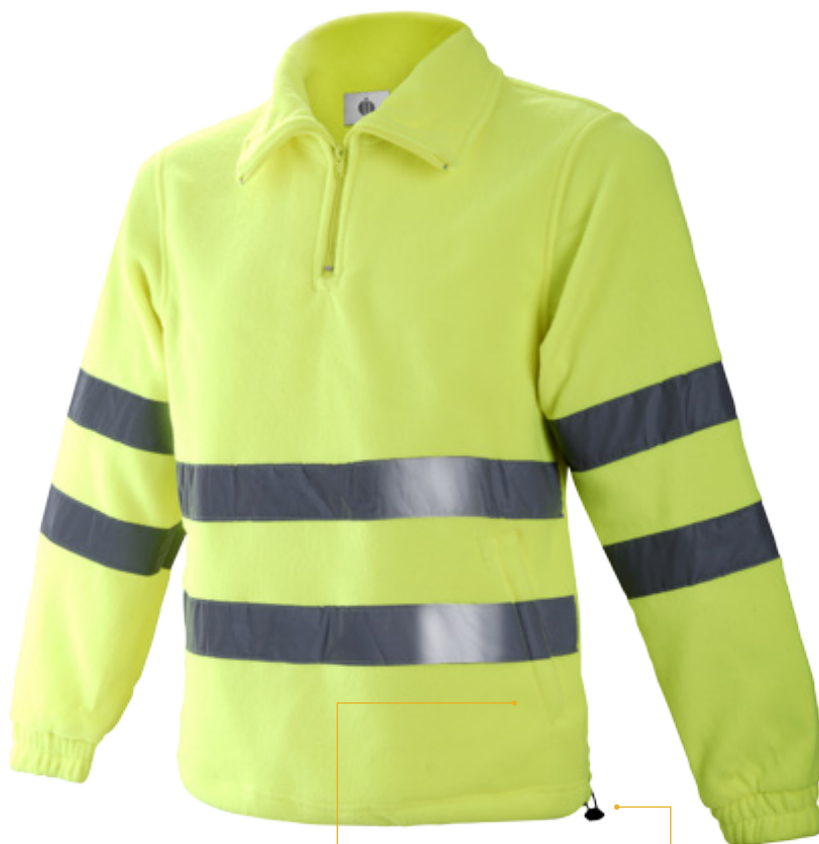
2 bolsillos con cremallera