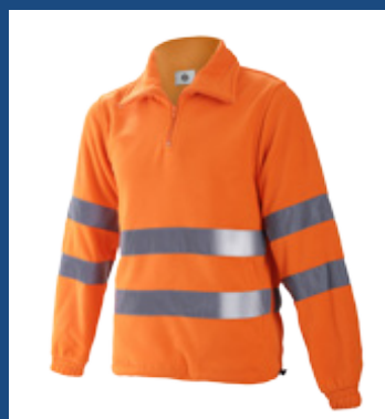
002 Naranja AV