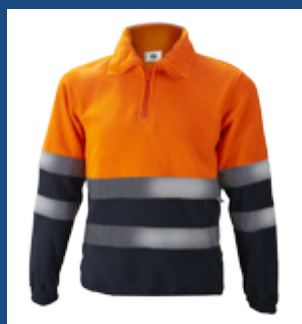
032 Marino/Naranja AV