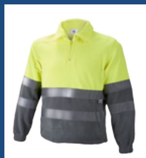
051 Gris/Amarillo AV