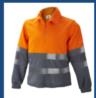
052 Gris/Naranja AV