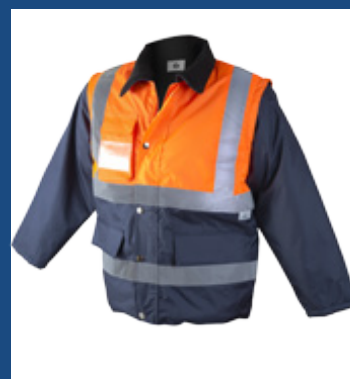
032 Marino/Naranja AV