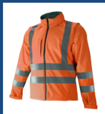
002 Naranja AV