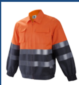
052 Gris/Naranja AV