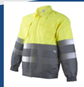
051 Gris/Amarillo AV