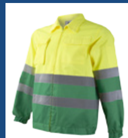
101 Verde medio/Amarillo AV