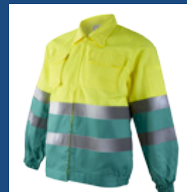
111 Verde claro/Amarillo AV