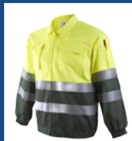
091 Verde oscuro/Amarillo AV