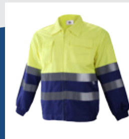
041 Azulina/Amarillo AV