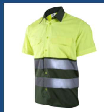
091 Verde oscuro/Amarillo AV