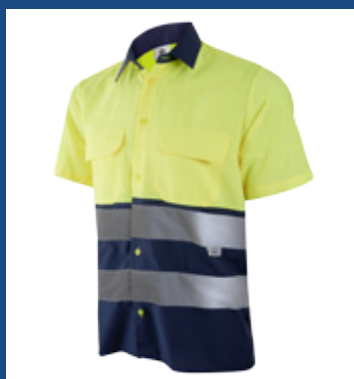
031 Marino/Amarillo AV