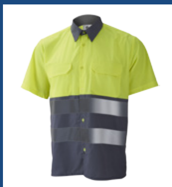
051 Gris/Amarillo AV