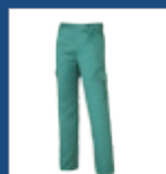
011 Verde claro