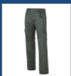
009 Verde oscuro