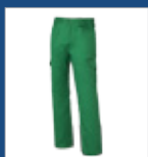
010 Verde medio