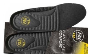
Plantillas extraíbles. Lavable