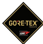
Membrana del forro impermeable + transpirable