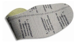
Plantilla de protección flexible