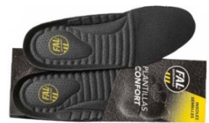
Plantillas extraíbles. Lavable