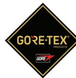
Membrana del forro impermeable + transpirable