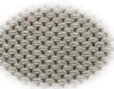
Forro de cuello transpirable