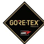
Membrana del forro impermeable + transpirable