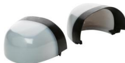
Puntera no metálica