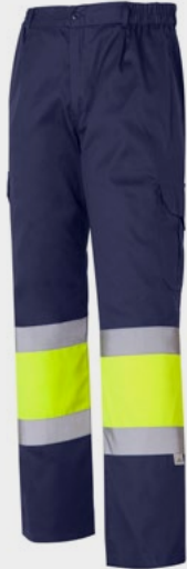
Medidas de la prenda en cm.